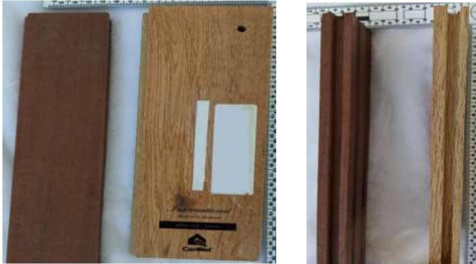
Image 2. Panneaux en bois plaqué décrits à la position 44.12 - Photo d'un panneau en bois plaqué avec feuille supérieure tournée face vers le haut, et deuxième photo de la coupe transversale du panneau en bois plaqué multicouches.

Image 1. Revêtements de sol en lames de bois décrits à la position 44.09 - Photo de deux échantillons de panneaux pour revêtements de sol, se composant chacun d'une lame de bois tournée face vers le haut, et deuxième photo de la vue latérale des bords à languettes et rainures des deux panneaux en lames de bois.